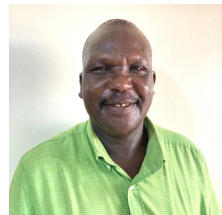
Raphael Amodoi Lira Regional Referral Hospital