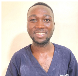
Emmanuel Emor New Hope Bidibidi Center