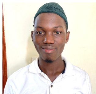
Harunah Ntabazi Ortoteck Kampala