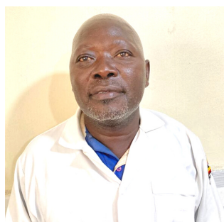
Kennedy S. Omara Lira Regional Referral Hospital