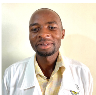
Benjamin Twongeirwe Kumi Hospital